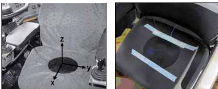
Figura 3 Ilustração de acelerômetros de assento e dos eixos de medição, posicionados para avaliação da exposição de condutor de veículo

A Figura 3 mostra exemplos de localização e fixação de acelerômetro de assento e o sistema de coordenadas ortogonais para a avaliação da exposição da exposição.