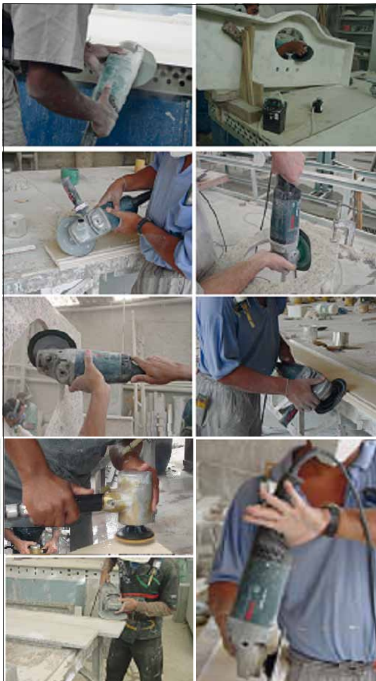
Figura 3 Ilustração de diferentes posturas e empunhaduras dos operadores durante rotinas de trabalho operando ferramentas manuais