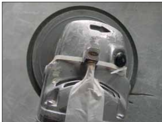
Figura 5 Ilustração de montagem em situações nas quais o operador não utiliza o punho auxiliar da ferramenta

A Figura 5, mostrada a seguir, apresenta uma situação de montagem e posicionamento do acelerômetro em uma condição de trabalho na qual o operador não faz uso do punho auxiliar da ferramenta, uma vez que segura diretamente no corpo dela. A mesma figura também ilustra uma forma de fixação do acelerômetro e de proteção da conexão e do cabo elétrico.