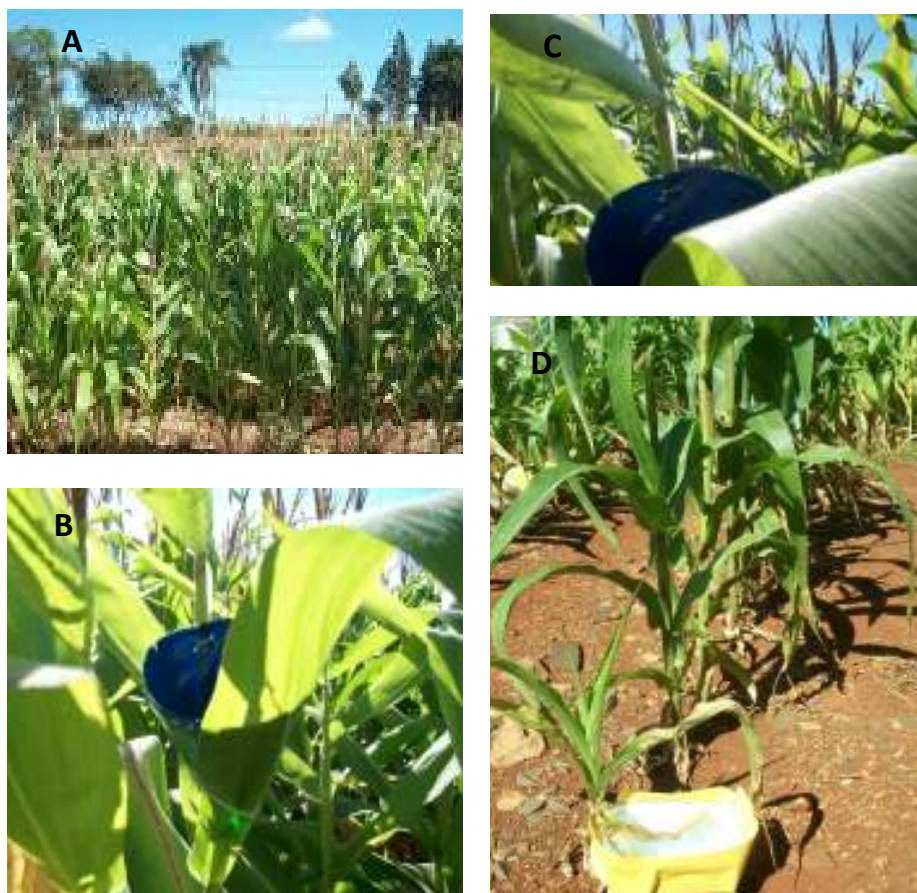
Figura 2. Armadilhas utilizadas na captura dos insetos. Em A, a área delimitada da cultura comercial de milho transgênico administrada pela empresa Belagrícola. Em B e C armadilha aérea de cor azul localizada nas folhas. Em D, armadilha de solo na cor amarela.