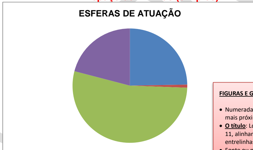
Gráfico 4: Esferas de atuação dos egressos