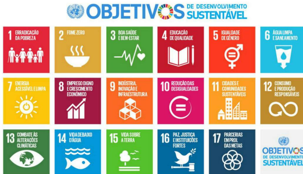
Figura 1 – Os 17 Objetivos de Desenvolvimento Sustentável correspondem ao plano de ação para as pessoas, para o planeta e para a prosperidade.