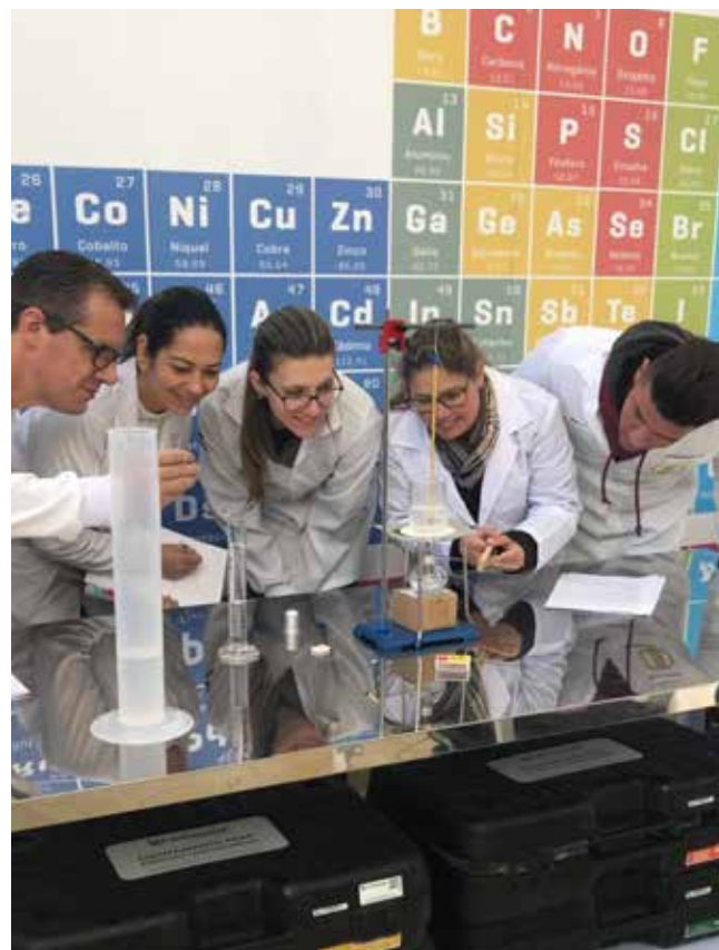
Alunos atentos no polo de Cascavel/PR