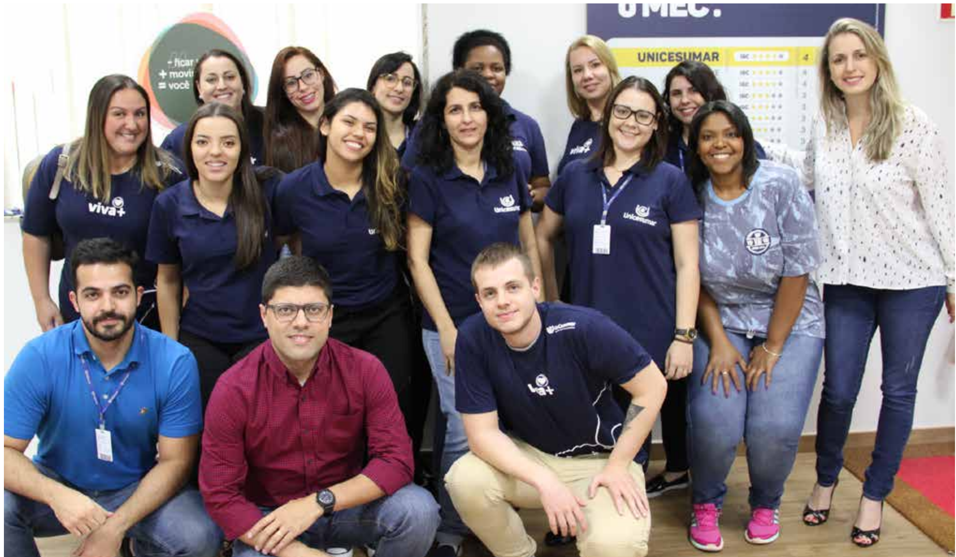
Equipe de cobrança e rematrícula call center - campus sede

são, mas não podemos esquecer que um aluno ativo e matriculado continua gerando receita para IES. Nós só temos a ganhar”.