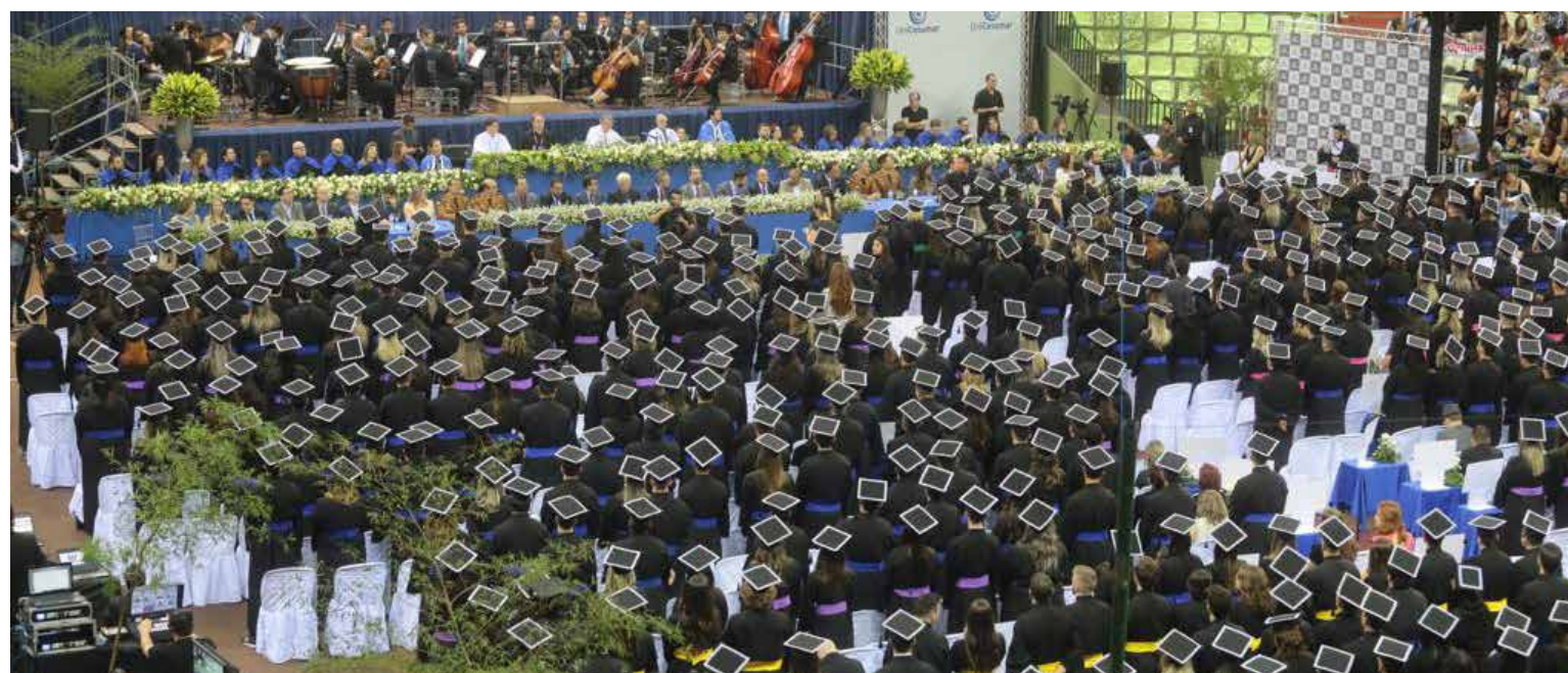
Cerimônia de Colação de Grau em Maringá/PR

Portal NEAD > Comunicação > Download de Arquivos > Processos 492 – Campanha Formandos 54.2018 – 51.2019.