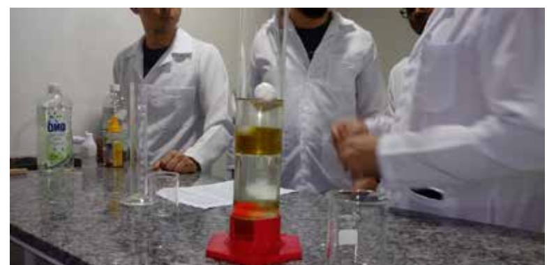
Atividade no polo do Rio de Janeiro/RJ