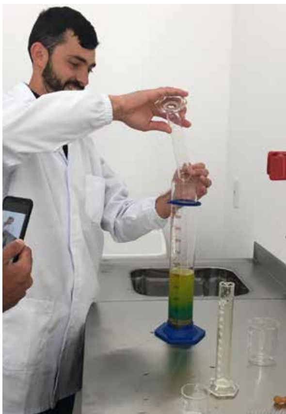
Aluno no polo de Criciúma/SC

De acordo com Thuinie Darios, head de Cursos Híbridos e Metodologias Ativas, as práticas laboratoriais consistem em três momentos significativos: pré-lab, lab e pós-lab. “Cada uma das etapas é constituída de uma atividade relevante para aplicação da prática laboratorial, de forma que os estudantes possam aplicar os conceitos teóricos por meio de um aprendizado ativo e significativo”, explica.