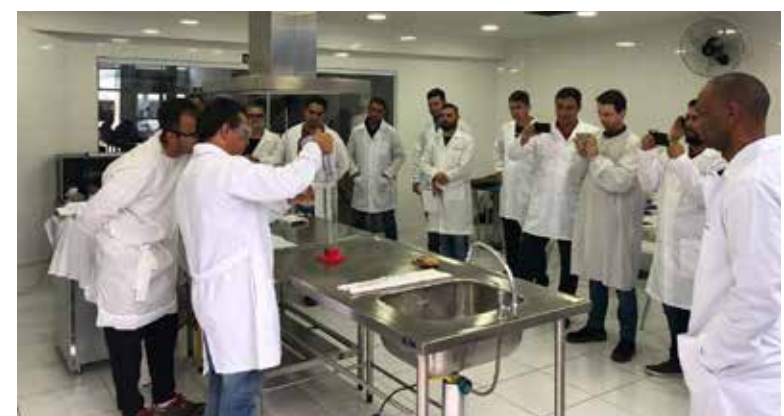
Turma de Engenharias do polo Campinas/SP