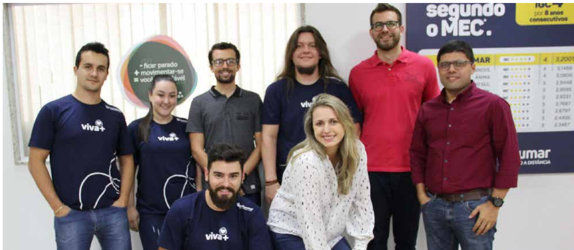
Time de Garantia de Receita, responsável por uma série de análises que garantem a assertividade do processo

quase R$ 2 milhões, apenas com essas ações.